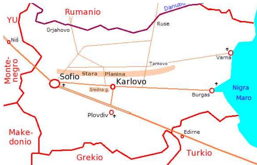
Bildo 2: Gravaj vojoj al Karlovo

Jan Amos KOMENSKÝ , Latine: Johannes Amos Comenius. ILe: Komenio (1592–1670) La fondinto de la moderna pedagogio ne nur teorie, sen ankaŭ praktike kontribuis al sia fako, i.a. per facila lingvoinstrua legolibro. Li proponis la enkondukon de planlingvo kaj la starigon de internacia akademio de la sciencoj.