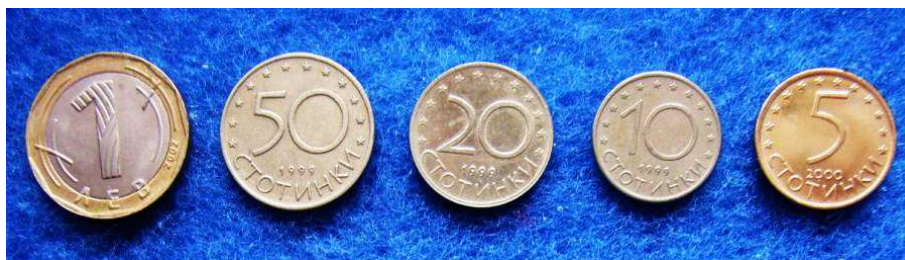
Bildo 1: Bulgaraj moneroj

validas. Biletoj de 1.000 aŭ 10.000 levoj estas malnovaj; cirkulas aŭtentikaj biletoj de 1, 2, 5, 10, 20, 50 kaj 100 levoj kaj moneroj de 5, 10, 20 kaj 50 stotinki kaj de 1 levo.